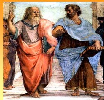
L'école d'Athènes – Raphaël – Détails (Palais du Vatican- Rome)